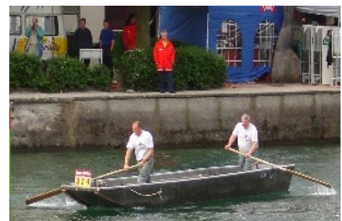
Boot auf der Ruderfahrt

Der Wettkampfparkours kann mit einem Hindernislauf auf dem Wasser verglichen werden. Es geht darum, verschiedene Übungsteile möglichst schnell und präzise zu absolvieren.