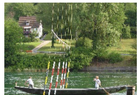
Weidling bei der Durchfahrt